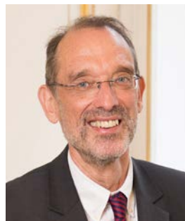
Univ.-Prof. Dr. Heinz Faßmann

Der Begriff „Kompetenz“ steht für „die Fähigkeit, etwas zu tun“. Kompetenz verbindet Wissen, Können und Handeln. Der Erwerb von Kompetenzen geht also über das reine Wissen hinaus. Kurz gesagt: Schülerinnen und Schüler sollen ihr Wissen so anwenden können, dass sie damit zur Problemlösung beitragen können. Die Förderung des Erwerbs und die faire Diagnose von bestimmten von den Schülerinnen und Schülern anwendbaren Fähigkeiten sind Anspruch und Ziel dieses umfassenden Pädagogik-Pakets, durch dessen Reformen sich der Kompetenzbegriff wie ein roter Faden zieht: Er beginnt bei den erstmals bundesweit präzise festgelegten Schulreife Kriterien als Grundlage für einen erfolgreichen Schulstart. Gleichzeitig bieten die neuen Lehrpläne für Volksschulen, Mittelschulen und die Unterstufe der AHS durch ihre konsequente Neuausrichtung auf bestimmte Kompetenzen mehr Freiraum für zeitgemäße Inhalte, für Interessengebiete und Schwerpunktsetzungen von einzelnen Schulen. Die Kompetenzraster stehen in enger Verbindung mit