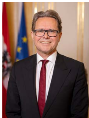
Bundesminister Dr. Martin Polaschek