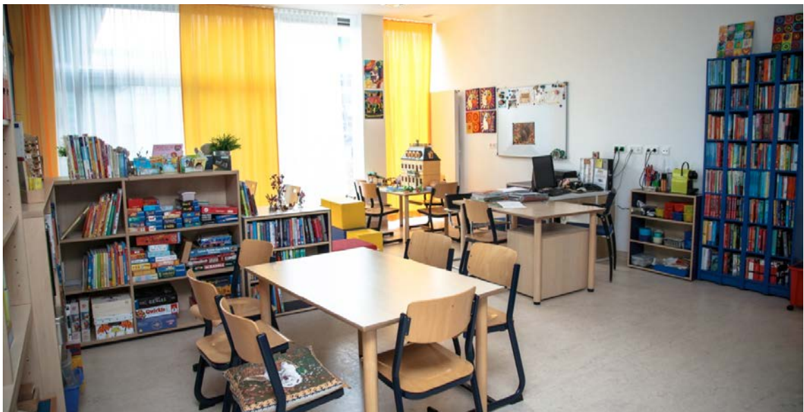
Schulraum der Heilstättenschule Niederösterreich

Die Heilstättenlehrerinnen und -lehrer arbeiten mit Kindern und Jugendlichen von der 1. bis zur 9. Schulstufe nach den Lehrplänen ihrer Herkunftsschulen, entweder in eigenen Klassenräumen oder bei nicht mobilen Patientinnen und Patienten am Krankenbett. Dies und auch die Zusammenarbeit im interdisziplinären Team erfordert von den Pädagoginnen und Pädagogen große Flexibilität und auch viel Kreativität. Für die kranken Kinder und Jugendlichen bringt der Schulbesuch Normalität in den Klinikalltag, Ablenkung von ihren Krankheiten und Beschwerden. Es hilft den Schülerinnen und Schülern einerseits schulisch auf dem Laufenden zu bleiben und Versäumtes nachzuholen.