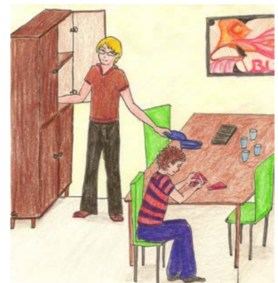
Dad and Paul lay the table.

c) Make more sentences about Mum and Paula, Mum and Dad, Paul and Paula, Dad and Paula, ..... write into your exercise book!