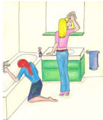
Mum and Paula clean the bathroom.