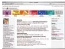
Službena spletna stran Ministrstva za šolstvo www.bmukk.gv.at