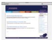
Šolska psihologija – izobraževalno svetovanje www.schulpsychologie.at