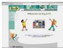
Gibanje in šport www.bewegung.ac.at