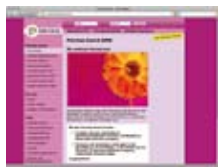
Fer šola www.faireschule.at