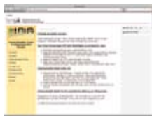
Interkulturno učenje http://ikl.bmukk.gv.at/