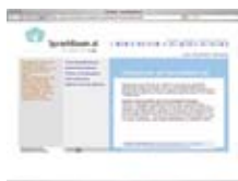
Zgodnja podpora jezika www.sprachbaum.at