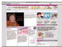
Bralna mreža www.lesenetzwirk.at