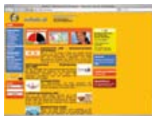
Šolski portal www.schule.at