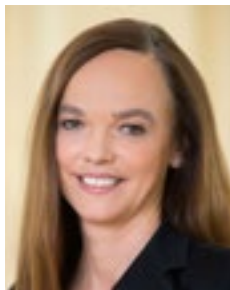
Dr. in Sonja Hammerschmid